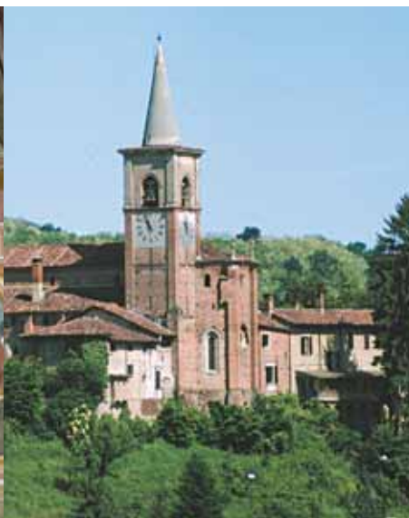
Borgo di Castiglione Olona