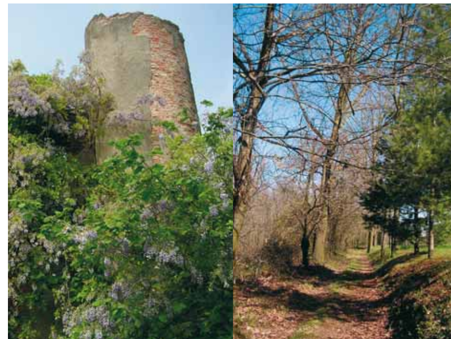
Ruderi e scorci di paesaggio nel Parco Pineta