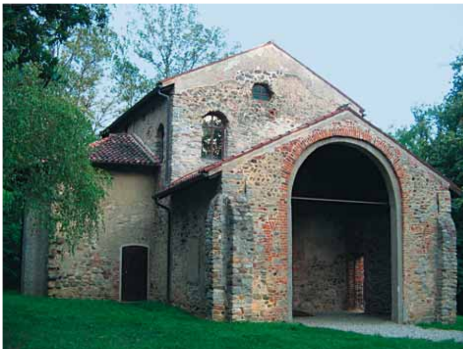
Chiesa di Santa Maria Foris Portas

Foris Portas - situabile tra il VI e il IX secolo - che conserva uno dei cicli di affreschi più importanti dell'Altomedioevo europeo. Ritornando a Castiglione Olona il percorso riprende attraversando i Comuni di Venegono Superiore ed Inferiore, da cui si entra nel territorio interessato dal Parco della Pineta di Appiano Gentile e Tradate. Proseguendo in direzione di Como si raggiunge il Comune di Castelnuovo Bozzente, sede del Parco, presso la quale termina l'itinerario.