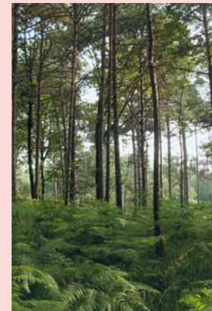
Esempi di vegetazione presente nel Parco

per informazioni relative a organizzazione di visite guidate e programmi di educazione ambientale rivolgersi alla sede del Parco sita in via Manzoni, 11 - Castelnuovo Bozzente (CO) tel. 031988430 - fax. 031988284 e-mail: parcopineta@libero.it