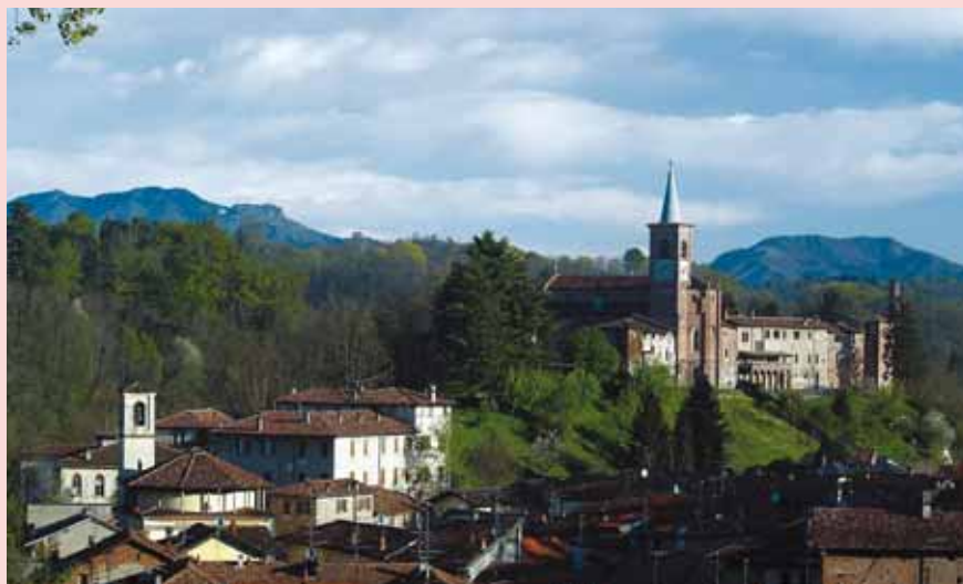
Castiglione Olona - la Collegiata

(1350-1443), nativo del luogo, legato pontificio e importante diplomatico. Egli affidò i lavori ad importanti artisti dell'epoca, quali Masolino da Panicale - figura chiave nella transizione dal Gotico Internazionale al Rinascimento, che nella Collegiata e nel Battistero ha lasciato due dei suoi più celebri cicli affrescati - Lorenzo Vecchietta e Paolo Schiavo, che portarono a Castiglione Olona le novità dell'arte toscana. In tal modo il borgo è diventato una delle città ideali del Rinascimento, nonostante la sua edificazione compatta rimarchi sostanzialmente il disegno medievale. Se anche il territorio lombardo è