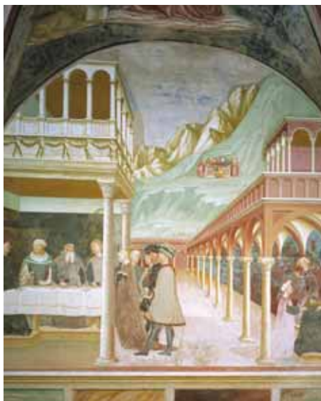
Battistero "Il Banchetto di Erode"

difensiva, risale all'epoca gota (V-VI secolo) e conserva interessanti affreschi dell'VIII secolo, dovuti alla sua trasformazione in cappella. Brani di affresco, oltre ad alcune tombe, sono venuti alla luce anche nella Chiesa di Santa Maria (XI secolo), dall'architettura semplice e povera, ad eccezione della raffinata abside romanica. Facilmente raggiungibile da Torba e Castiglione Olona è l'importante sito archeologico di Castelseprio, antica